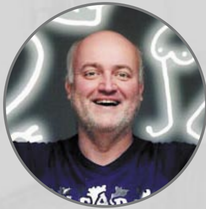
Bernhard Ludwig Kabarettist