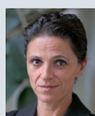
Karin Bauer DER STANDARD