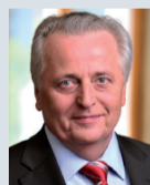
Rudolf Hundstorfer Bundesminister für Arbeit, Soziales und Konsumentenschutz