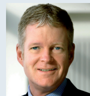
Holger Schwannecke Generalsekretär des Zen- tralverbands des Deutschen Handwerks (ZdH)